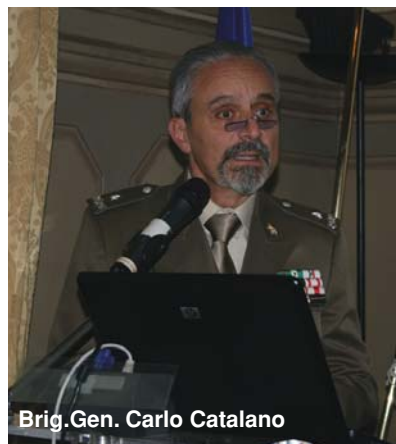
Brig. Gen. Carlo Catalano