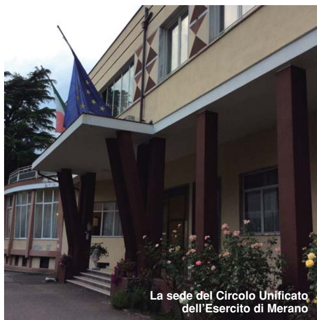
La sede del Circolo Unificato dell'Esercito di Merano

parto Ufficio Affari Generali; per i nostri soci che volessero trascorrere un fine settimana o un periodo di riposo, potranno chiedere informazioni alla nostra Associazione per avviare la domanda. La Foresteria si compone di numero 10 camere matrimoniali, di un grande salone per le feste o matrimoni, di una grandissima sala da pranzo e di vari locali di ricreazione, Bar interno ed esterno sotto un gazebo. Attualmente