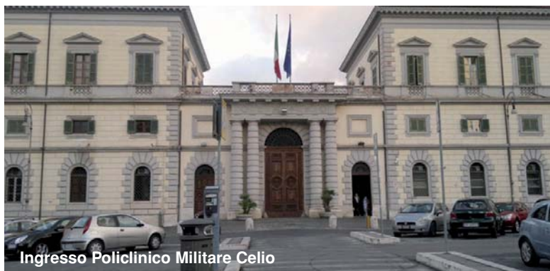
Ingresso Policlinico Militare Celio